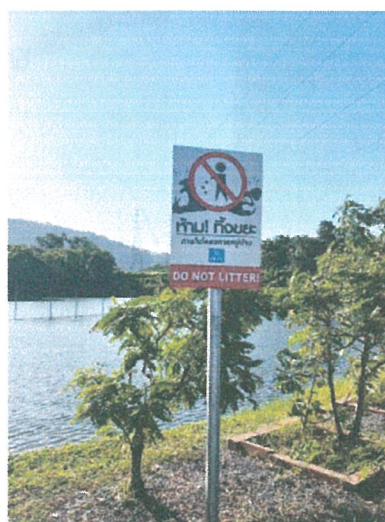
รูปภาพที่ 2.20 ป้ายห้ามทิ้งขยะภายในโครงการ