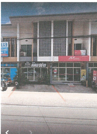
รูปภาพที่ 2.7 เส้นแบ่งช่องสำหรับจอดรถบริเวณหน้าอาคารพาณิชย์