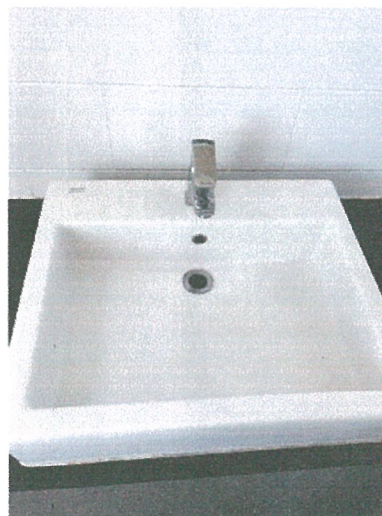
รูปภาพที่ 2.13 สุขภัณฑ์ประหยัdnน้ำ