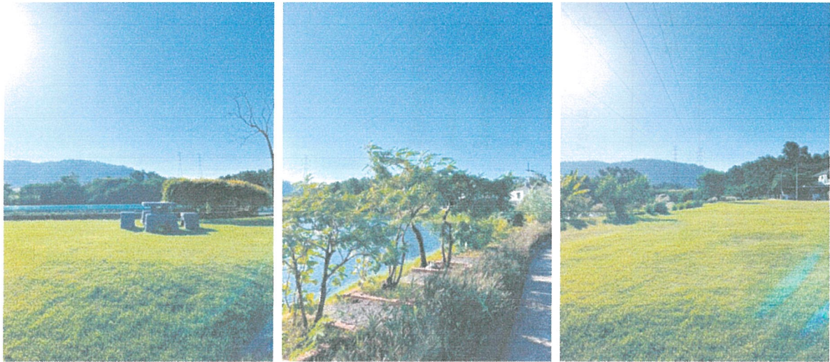
รูปภาพที่ 2.1 พื้นที่สีเขียวภายในโครงการ