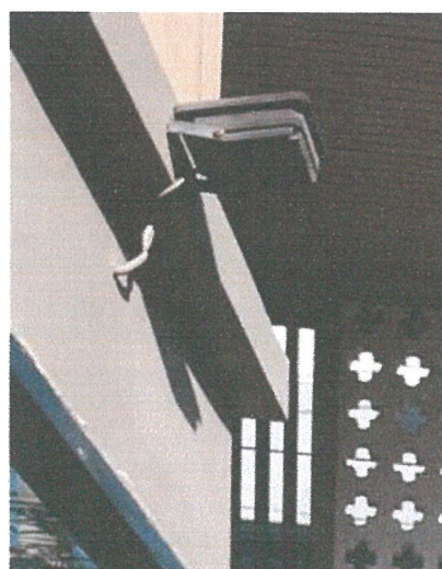
รูปภาพที่ 2.9 ไฟฟ้าส่องสว่างบริเวณทางเข้า-ออก