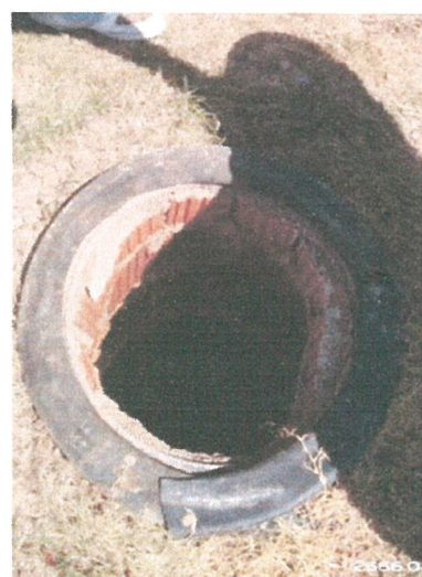
รูปภาพที่ 2.16 ระบบบำบัดน้ำเสีย