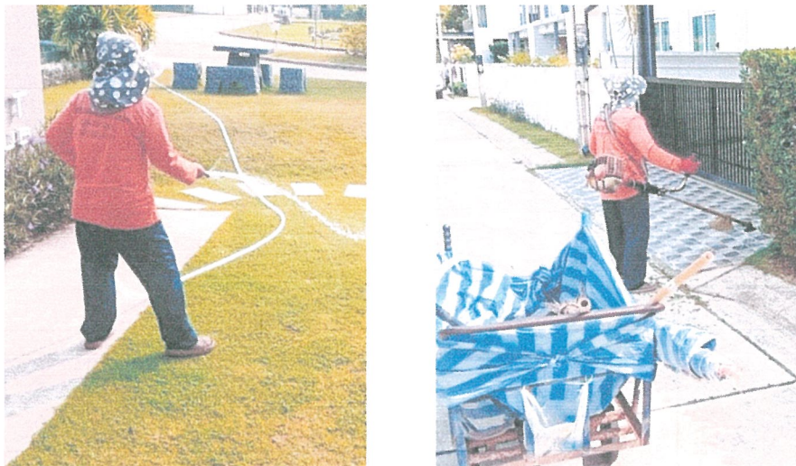
รูปภาพที่ 2.2 งานดูแลสวน