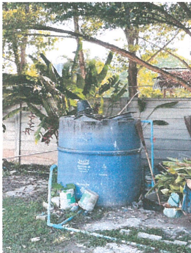
รูปภาพที่ 2.11 ถังเก็บน้ำสำรอง