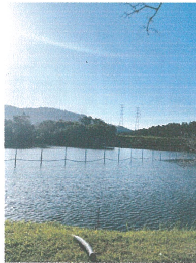
รูปภาพที่ 2.12 สระน้ำของโครงการ