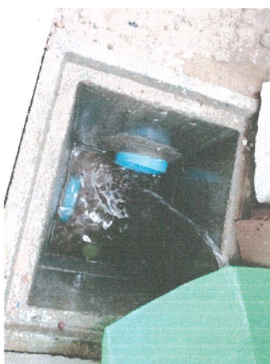
รูปภาพที่ 2.15 การขุดลอกตะกอน