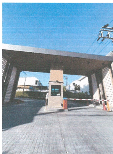
รูปภาพที่ 2.8 ทางเข้า-ออกโครงการ