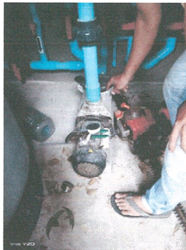
รูปภาพที่ 2.14 การตรวจสอบระบบท่อจ่ายน้ำ