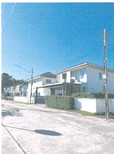
รูปภาพที่ 2.3 สีสอาคารของโครงการ