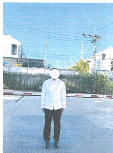
รูปภาพที่ 2.6 เจ้าหน้าที่รักษาความปลอดภัย