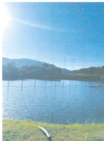
รูปภาพที่ 2.4 เสาตาข่ายกันแนวเขตที่ดิน