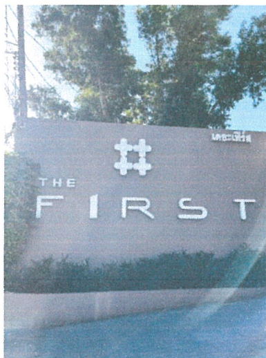
รูปภาพที่ 2.5 ป้ายโครงการ