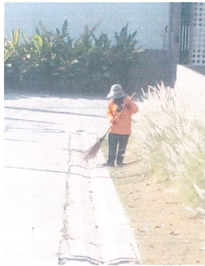
รูปภาพที่ 2.10 การกวาดพื้นถนน