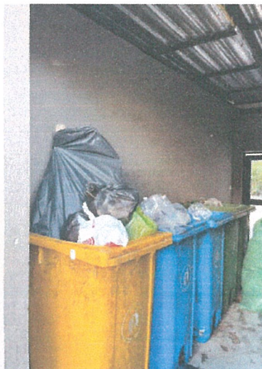
รูปภาพที่ 2.18 ถังขยะแยกประเภท