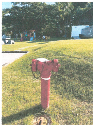
รูปภาพที่ 2.22 หัวรับน้ำดับเพลิง