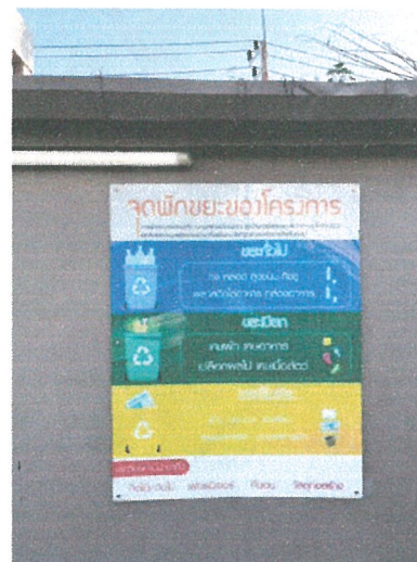
รูปภาพที่ 2.19 ป้ายรณรงค์คัดแยกขยะมูลฝอย